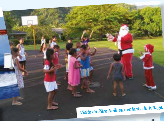
Visite du Père Noël aux enfants du Village.