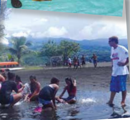
D'autres préfèrent jouer sur la plage sous la surveillance de nos amis de la Saga.