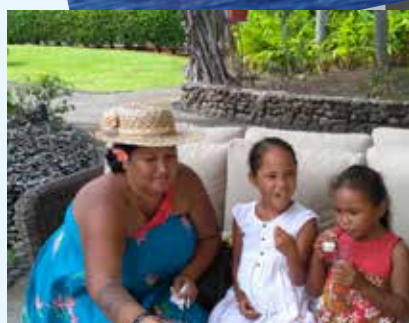
Goûter organisé à l'Hôtel Le Méridien Tahiti pour la clôture de l'opération "Les Sapins du Cœur".