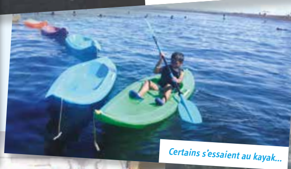
Certains s'essaient au kayak...