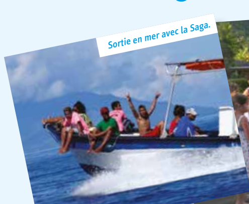
Sortie en mer avec la Saga.