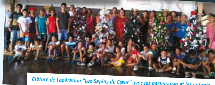
Clôture de l'opération "Les Sapins du Cœur" avec les partenaires et les enfants.