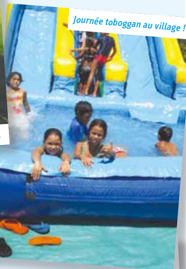
Journée toboggan au village !